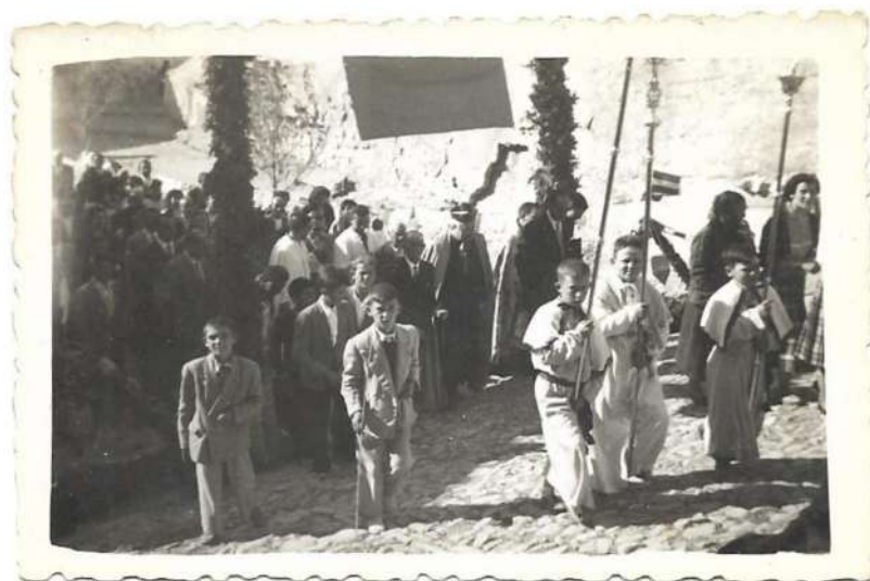
Semana Santa, (sin fecha)