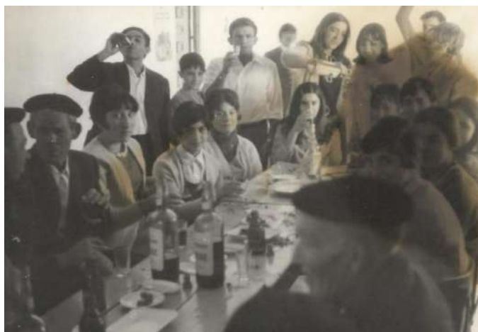
Fiestas, (sin fecha)