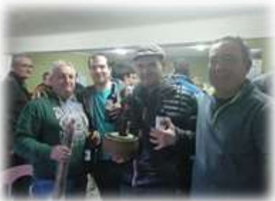
Semana Santa fresquita y con actividades

organizadas por la comisión de fiestas de verano. Aquí arriba podemos encontrar a los ganadores de los campeonatos de guiñote y rabino, también hubo campeonato de birlos en la plaza con un gran ambiente, a cuyos ganadores se puede encontrar en la portada de este número del Eco.